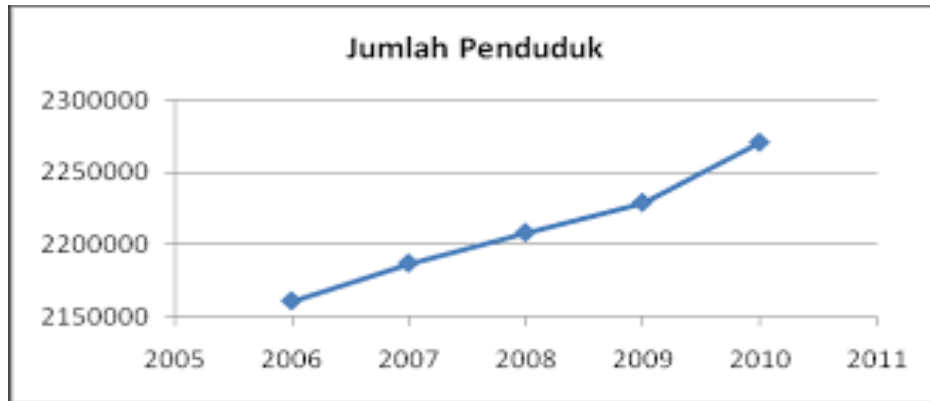
Gambar 4.2. Grafik Jumlah Penduduk